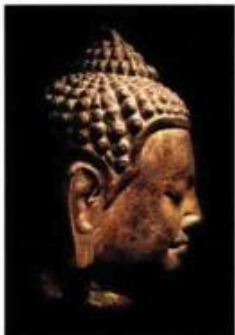
Tête de Bouddha, Cambodge, époque post-Ângkor, fin XIII e -début XX e siècle. Grès, 25,5 x 20 x 17 cm. Paris, galerie Jacques Barrère.